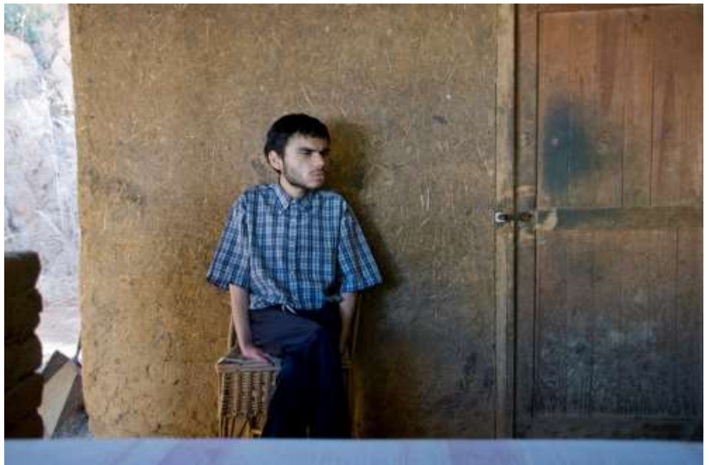
Paz Errázuriz, La luz que me ciega, aus der Serie La luz que me ciega, 2008-2010.