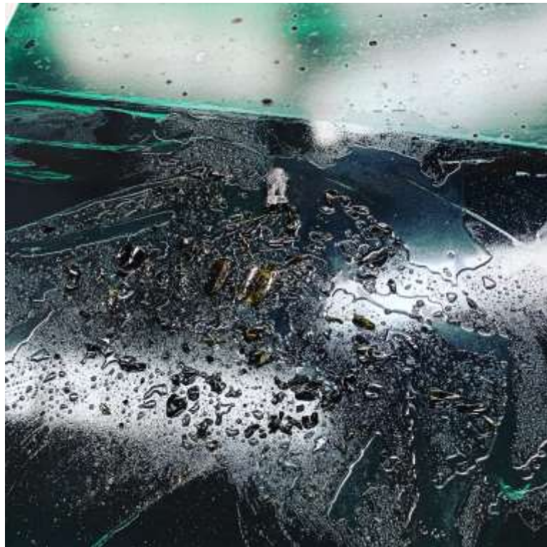
Michael Günzburger, Moment du processus lors de l'impression du champagne , Arni (Bern), 2022. © Photo : Michael Günzburger. Courtesy : Musée des Beaux-Arts Le Locle

hinterfragt, vom Zustand der Rohstoffe, ob roh oder gekocht, bis hin zum visuellen Aspekt der Gerichte, der aus einer langen Tradition der Haute Cuisine stammt. Wir haben gekocht, geschmeckt und gedruckt. Das ist auch ein Weg, um zu verstehen, was man isst, und ausserdem macht es ein Bild. All diese Verbindungen und Schritte sind in diesen Drucken enthalten. Und der Aspekt der Vergänglichkeit der Nahrung, die man zu sich nimmt und die danach wieder verschwindet, gefällt mir sehr und schliesst sich dem chimärischen Aspekt meines Ansatzes an. Die Idee, für die Ewigkeit zu schaffen, interessiert mich nicht, ich mache Kunst für die Lebenden und eine bestimmte Idee des Kollektivs.