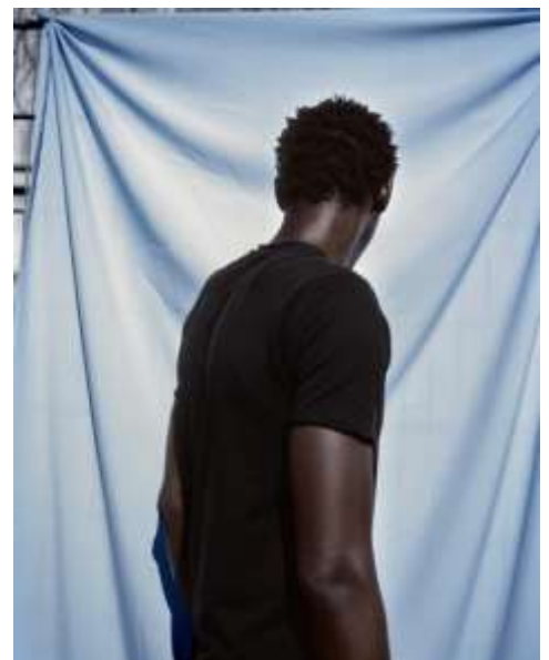
Laurence Rasti mit A., D., G., L., M., N., T., Z., Un mur comme horizon , 2023, Film diapositive.