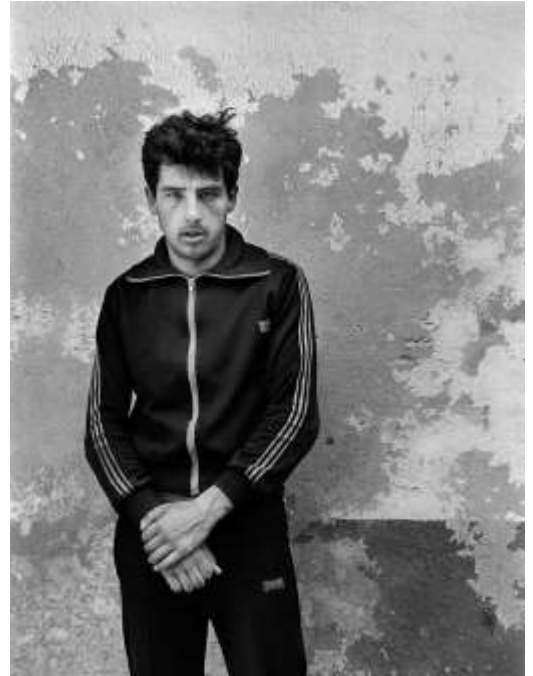
(links) Paz Errázuriz, Cuerpo II, Santiago , aus der Serie Cuerpos, Santiago , 2002.