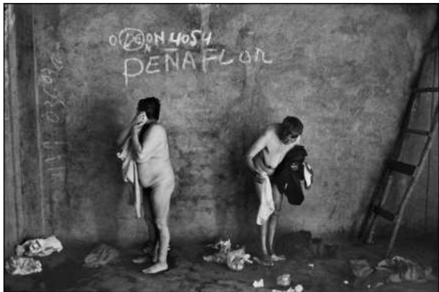
Paz Errázuriz, Baño X, aus der Serie Antesala de un desnudo , 1999. © Paz Errázuriz. Colecciones Fundación MAPFRE

Letztendlich bin ich investigativ, ich beschäftige mich mit den Menschen um mich herum. Das ist eine Möglichkeit, sie zu verstehen, ihnen nahe zu sein und mich selbst kennenzulernen. Ich informiere mich, bevor ich sie treffe, und habe ein ziemlich gutes Wissen über die Geschichte im Allgemeinen. Danach stelle ich mich ihnen vor und erkläre ihnen, was ich vorhabe, nämlich Fotos zu machen und einige Gespräche aufzuzeichnen, was ich auch für La manzana de Adán getan habe. Ich nahm über ein Jahr lang auf, bevor ich einen Journalisten, den ich kannte, einlud, über darüber zu schreiben. Ich habe in gewisser Weise einen anthropologischen Ansatz. Und es ist nötig, dass er weiss, was ich mache, ohne Versprechen auf eine Ausstellung oder Buchveröffentlichung. Während der Diktatur wollte ohnehin niemand meine Fotografien ausstellen. Und ich war mir zu Beginn meiner Karriere nicht einmal sicher, ob ich sie überhaupt zeigen wollte. Ich bin eine unabhängige und autodidaktische Fotografin. Ich bin keinem bestimmten Weg gefolgt.