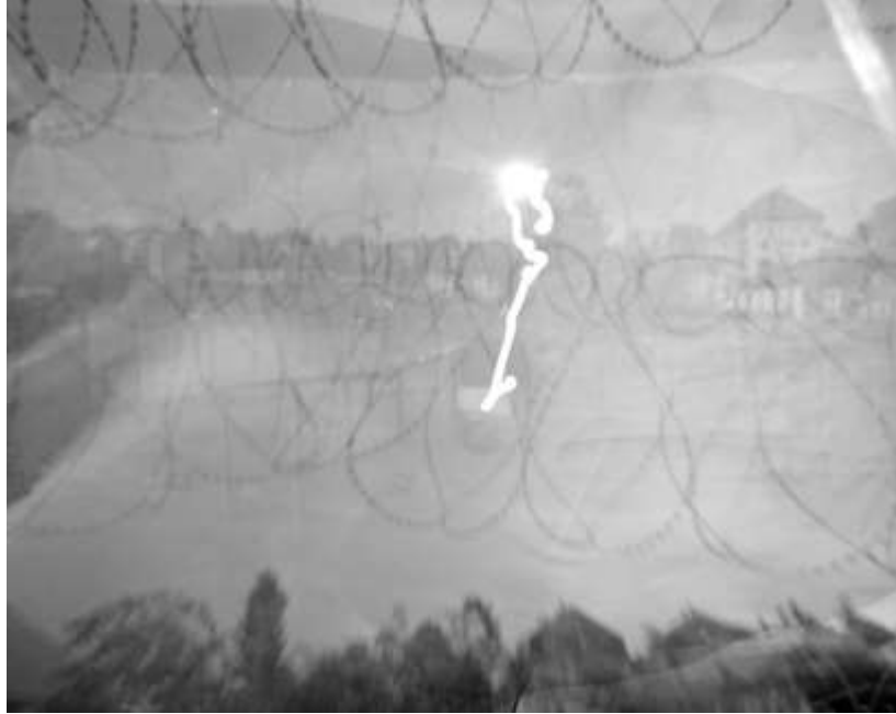
Laurence Rasti mit A., D., G., L., M., N., T., Z., Sténopé réalisé par N. , Un mur comme horizon , 2023. Original photosensibles Papier, 10 x 15 cm, Reproduktion in Pigmentdruck.

Die Schweizer Fotografin iranischer Herkunft Laurence Rasti, Autorin des Buches There Are No Homosexuals in Iran (2017), ist die Preisträgerin der Enquête photographique neuchâteloise 2024 , die jedes Jahr von der Association pour la promotion de la photographie dans le canton de Neuchâtel (APPCN) organisiert wird. Sie führte ein kollaboratives Projekt mit Insassen eines Gefängnisses im Kanton Neuenburg durch, dem Etablissement de détention La Promenade in La Chaux-de-Fonds (EDPR) . Laurence Rasti, eine engagierte Fotografin, die zu den Themen Menschenrechte, Migration und Prekarität arbeitet, thematisiert in diesem Projekt das Problem der Überrepräsentation armutsgefährdeter Personen, die für kurze Haftstrafen inhaftiert sind. Indem sie den Zusammenhang zwischen Gefängnisjustiz und sozialer Gerechtigkeit hinterfragt, stellt sie eine Praxis der Inhaftierung in Frage, die scheinbar auf die Schwächsten abzielt. Nach mehreren Monaten intensiver Recherche über das Schweizer Gefängnissystem traf die Fotografin acht Gefangene, denen sie vorschlug, Co-Autoren dieser Arbeit zu werden, indem sie an der Darstellung ihrer Situation mitarbeiteten, insbesondere durch das Fotografieren mit einer Lochkamera.