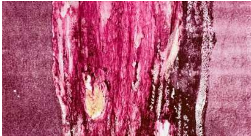
Michael Günzburger, Ein Zweiter Teller mit Tagliolini (détail), 2023. Teigwaren, Crevetten, Safran und lithografische Tinte auf Papier, 80 x 40 cm. © Photo : Michael Günzburger. Courtesy : Musée des Beaux-Arts Le Locle

Woran erinnert der Titel der Ausstellung Follow the Crackling Sound (lit. Folgen Sie dem knisternden Geräusch)?