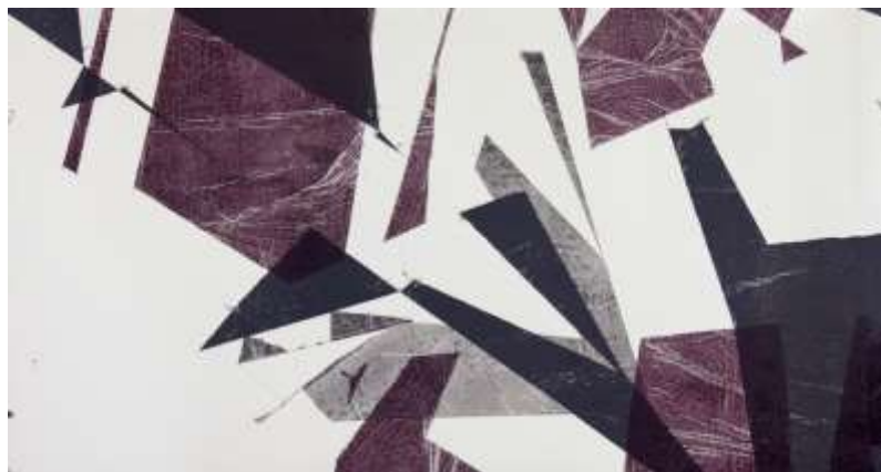
Michael Günzburger, Dann falte die Transparenz wieder auf , 2024. Verpackungspapier und lithographische Tinte auf Papier, 150 x 250 cm.

Der renommierte Schweizer bildende Künstler Michael Günzburger praktiziert und untersucht das Drucken in seiner performativen Dimension,