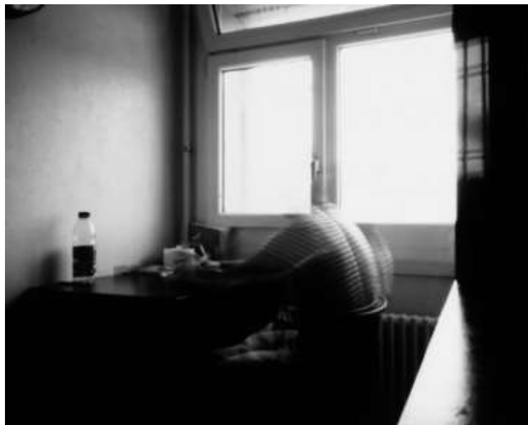
Laurence Rasti mit A., D., G., L., M., N., T., Z., Sténopé réalisé par Z., Un mur comme horizon , 2023. Original photosensibles Papier, 10 x 15 cm, Reproduktion in Pigmentdruck.

In meinem vorherigen Projekt Venuses, das sich mit Fragen der Weiblichkeit und Identität befasst, habe ich die beiden Personen, die ich fotografiert habe, auch als Autorinnen des Projekts betrachtet, denn wenn sie nicht da wären, würde das Projekt nicht existieren. Sie sind also auch Inhaber der Rechte. In anderen Projekten bezahle ich die Arbeitszeit der teilnehmenden Personen. Im Gefängnis erwies sich dies als komplizierter, da einerseits die Anonymität gewahrt werden musste, so dass die Inhaftierten nicht wirklich Mitautoren sein konnten. Und andererseits warf ihre Bezahlung Probleme mit der Gleichheit innerhalb der Gemeinschaft der Inhaftierten auf. Ich spendete daher einen Betrag in Höhe ihres Beitrags an Vereine, die Inhaftierten während ihrer Haft helfen, die ohne jegliche Mittel und ohne Hilfe von aussen sind.