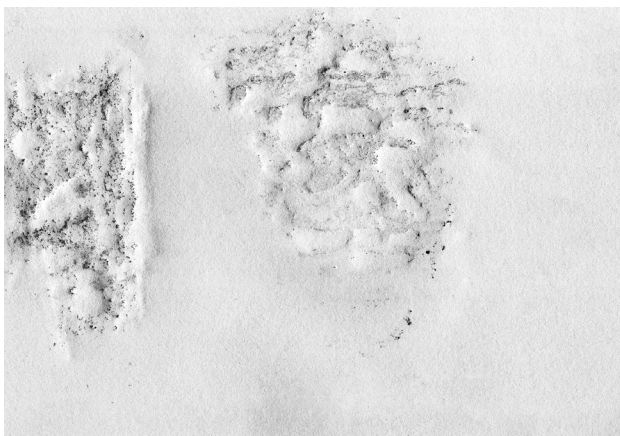
IMG_58, 2024.