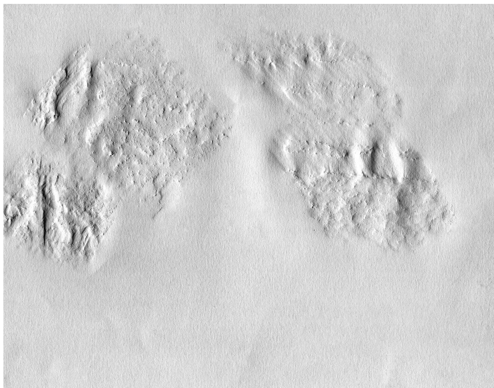
IMG_12, 2024.

18.11 - 02.12.2024 : SITE HOSPITALIER DE POURTALÈS